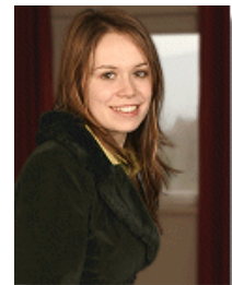
Av. Andrada Sarb