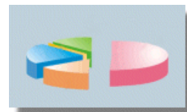
Das Gesetz über den Haushalt der Sozialversicherungen verändert beginnend mit Januar 2007 die Prozentsätze einiger Sozialversicherungsbeiträge und die Beträge einiger Bemessungsgrenzen.

Die finanziellen Mittel dieses Fonds werden unter anderen durch Beiträge seitens der Arbeitgeber gebildet, welche den Prozentsatz von 0,25% betragen und auf die gesamten Brutto-Löhne ( fond total de salarii brute ) berechnet werden. Der Beitrag wird separat ausgewiesen und entrichtet. Darüber hinaus besagt das Gesetz, dass zum Zeitpunkt des Inkrafttretens des Gesetzes der Beitrag des Arbeitgebers zur Arbeitslosenversicherung um den gleichen Prozentsatz herabgesetzt wird, so dass diese Neuauflage keine Änderungen der Lohnnebenkosten bewirkt.