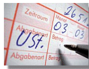
Das rumänische Steuergesetzbuch wurde modifiziert und geändert. Hervorzuheben sind auch umfangreiche neue Ausführungen im Bereich der Umsatzsteuer.