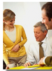
Betroffen vom Gesetz Nr. 467/2006 bzgl. Unterrichtung und Anhörung von Arbeitnehmern sind alle in Rumänien ansässigen Unternehmen ab einer Mitarbeiteranzahl von 20.

„Arbeitserlaubnisse benötigen grundsätzlich sowohl bei rumänischen Arbeitgebern beschäftigte Ausländer als auch aus dem Ausland nach Rumänien entsandte Arbeitnehmer ausländischer Arbeitgeber.“